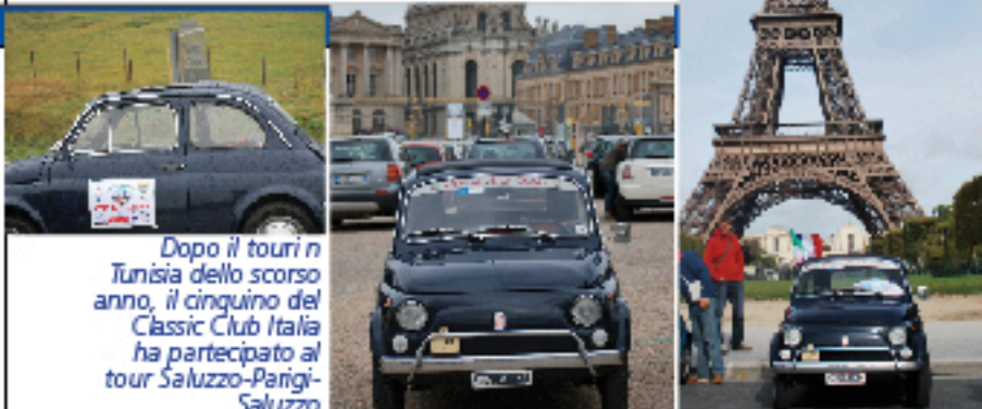
Dopo il tour in Tunisia dello scorso anno, il cinquino del Classic Club Italia ha partecipato al tour Saluzzo-Parigi-Saluzzo